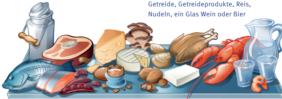
Milchprodukte, Fisch, Fleisch, Geflügel, Eier, Tofu, Hülsenfrüchte, Pilze