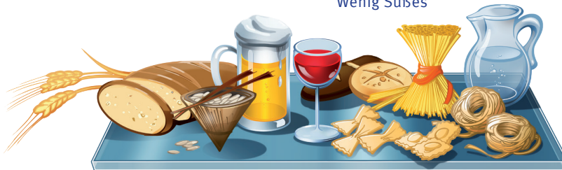
Getreide, Getreideprodukte, Reis, Nudeln, ein Glas Wein oder Bier