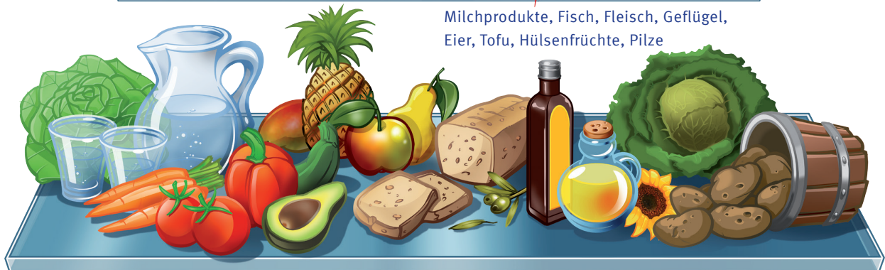
Frisches Obst, Gemüse, Salat zubereitet mit gesundem Öl, Roggenbrot, Pellkartoffeln